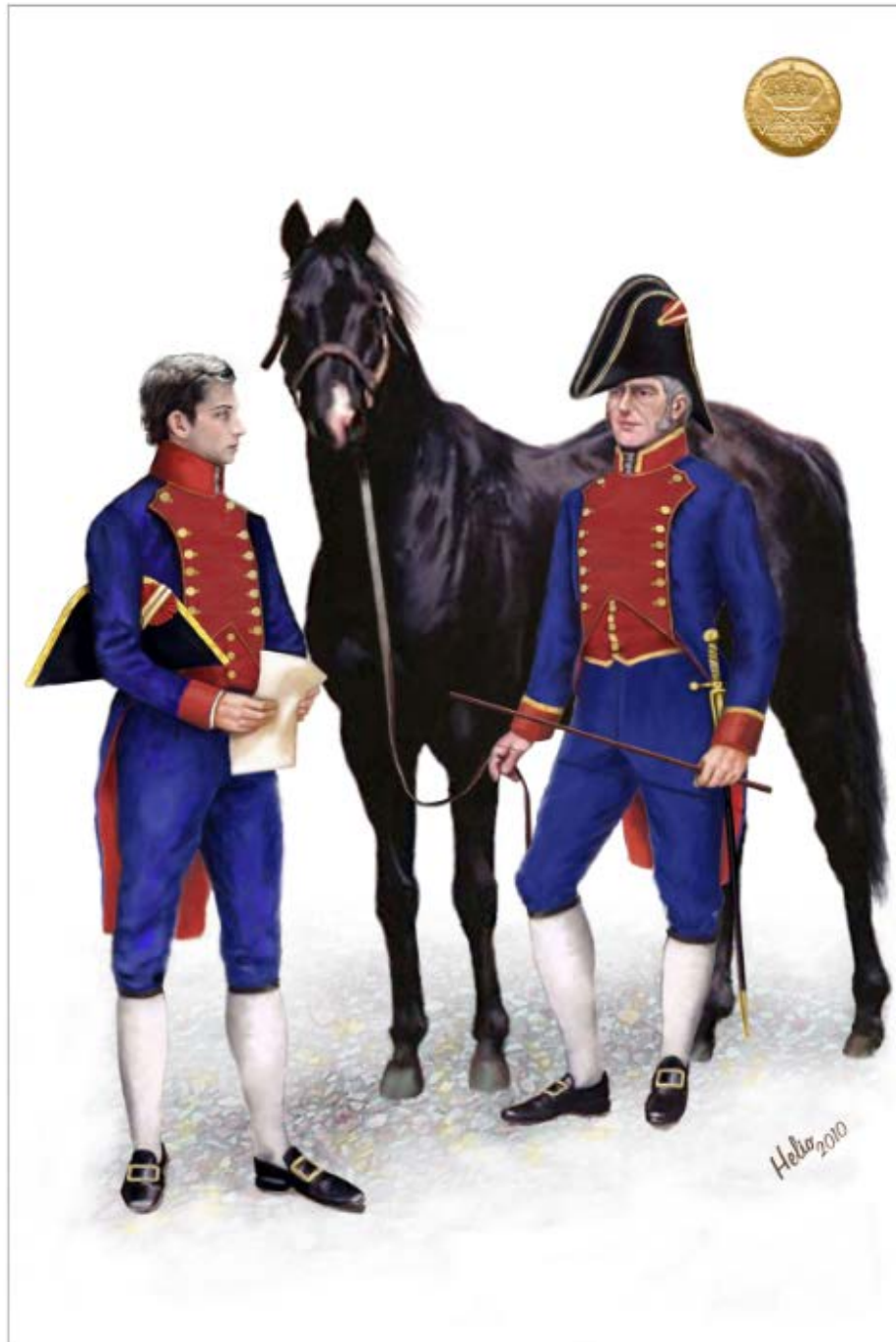
PROFESOR Y ALUMNO DE LA REAL ESCUELA DE VETERINARIA 1800