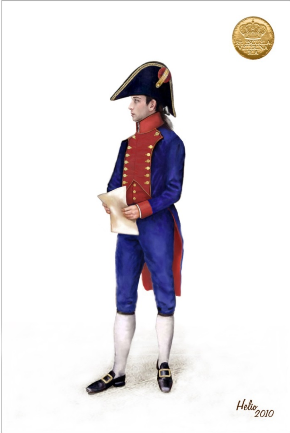
ALUMNO DE LA REAL ESCUELA VETERINARIA 1800