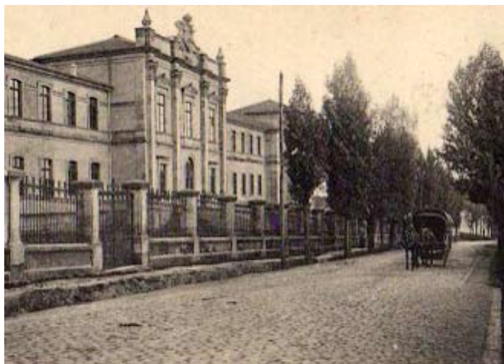
ESCOLA DE VETERINARIA DE SANTIAGO (1915)

Durante a Asemblea Rexional de Veterinarios de Galicia celebrada en Santiago os días 10 e 11 de xaneiro de 1920 acordouse formar unha asociación co nome de Sindicato Rexional de Veterinarios de Galicia