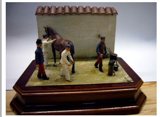
En el herradero-1898 Autor: Equipo A Año: 2007

diorama muestra la castración de un caballo derribado sobre una cama de paja.