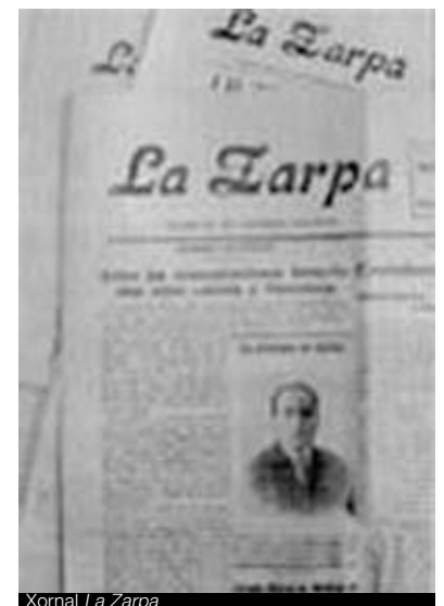
Xornal La Zarpa

Tamén participou activamente a favor do plebiscito estatutario galego de 1936, transmitindo nos mítines, co seu verbo fácil, unha identificación con Galicia que ía moito máis alá do puramente coxuntural, cunha visión de país moi avanzada para a súa época.