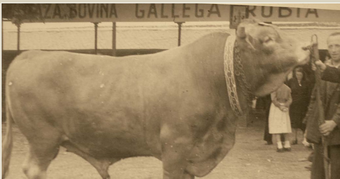
Feria del Campo. 1955

EN 1933 LA DIRECCIÓN GENERAL DE GANADERÍA ESTABLECE EL ESTÁNDAR RACIAL Y LA CREACIÓN DEL REGLAMENTO OFICIAL DE LOS LIBROS GENEALÓGICOS SIENDO A PARTIR DE AQUÍ CUANDO SE DENOMINA RAZA RUBIA GALLEGA.