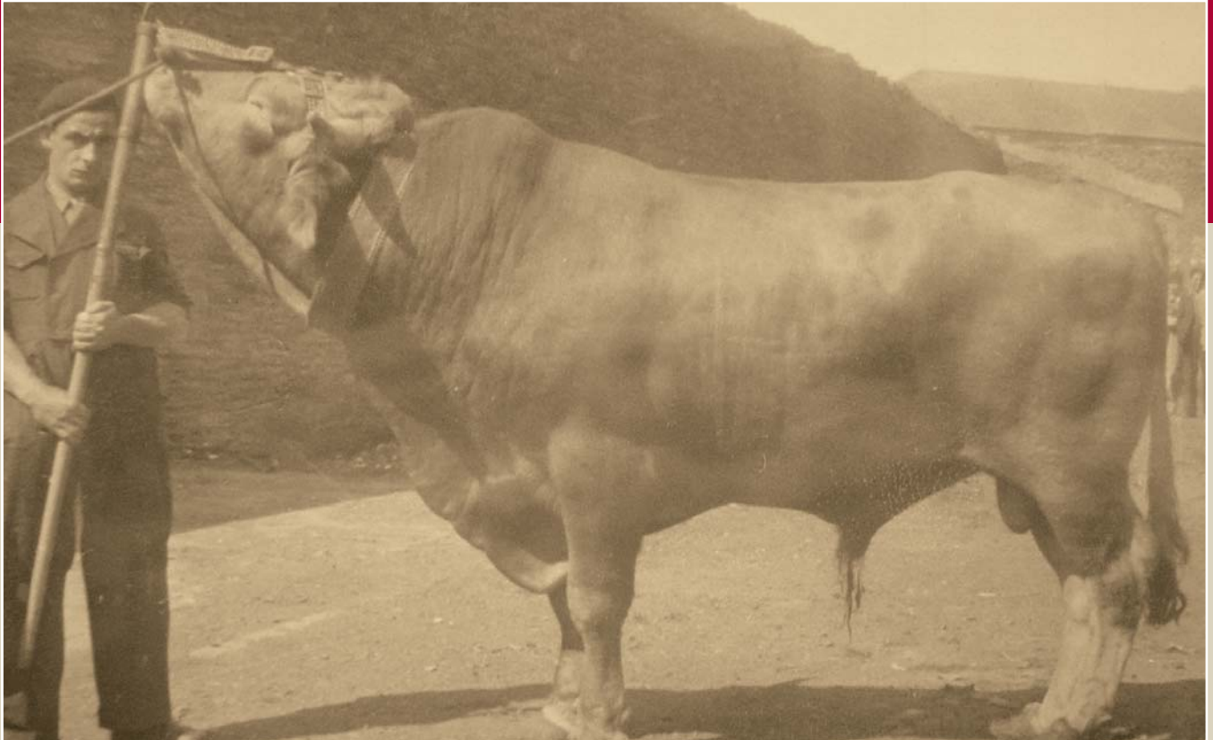
Concurso de Ganados de Lugo en 1914

conservaba caracteres de trabajo y lecheros, y aumenta de forma sustancial los rendimientos de la canal e índices de crecimiento con el cruce del país.