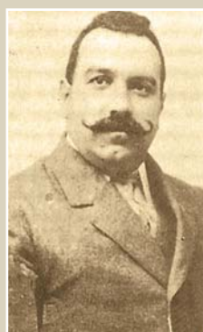
Juan Rof Codina

EL TRABAJO DE ROF NO SE CIÑÓ A UNA SIMPLE MEJORA MORFOLÓGICA, SINO QUE TAMBIÉN INCIDIÓ EN PRO DE MODIFICAR LAS CONDICIONES EXTERNAS QUE AFECTABAN AL GANADO E IMPEDÍAN EL PROGRESO Y EL AVANCE DE ESTE.