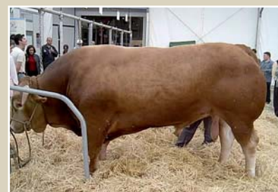
Macho raza rubia en la actualidad

dida en las subrazas de montaña y de valle. En 1916 el veterinario Juan Rof Codina publica la monografía sobre a Raza Bovina Gallega premiada por la Asociación de Ganaderos del Reino. Es en este libro donde se ponen las bases del morfotipo del rubio gallego. En 1933 la Dirección General de Ganadería establece el estándar racial y la creación del reglamento oficial de los libros genealógicos siendo a partir de aquí cuando se denomina Raza Rubia Gallega.