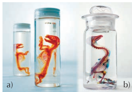
FIGURA 3. Transparentizaciones a) rata; b) pato, preparación en fluido, glicerina, depósito del Departamento de Anatomía y Anatomía Patológica Comparada (Anatomía y Embriología). Patrimonio Histórico Universidad Complutense de Madrid.

vestigar y educar, sino también sirve como puente comunicativo entre el hombre y su pasado, la globalización de la cultura y la tecnología, que es antiguo en la medicina veterinaria. Se inició en la misma época en que