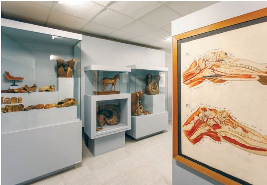
FIGURA 1. Vista de la sala del almacén abierto al público del Museo Veterinario Complutense, en el Hospital Clínico Veterinario, mostrando óleos de anatomía y parte de la colección de piezas de cera policromada realizadas en el primer tercio del siglo XIX. Patrimonio Histórico Universidad Complutense de Madrid (Cortesía: Museo Veterinario Complutense [MVC], Universidad Complutense de Madrid [UCM]).