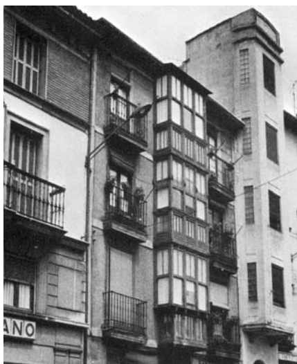
Domicilio de los Lecuona en Ordizia

Aunque legalizó su título en el Viceconsulado argentino en Madrid el 26 de junio de 1908, no llegó a ejercer la profesión en la nación austral.