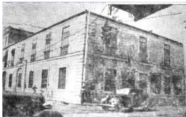
Viejo caserón de Zanja y Belascoaín, en La Habana, perteneciente a la Facultad de Medicina y Farmacia de la Universidad de La Habana, donde funcionó la Escuela de Medicina Veterinaria hasta 1942

Al ser incorporada a la Universidad de La Habana como una escuela más de la Facultad de Medicina, se hizo cargo de la Cátedra "C" (Patología General y Especial y sus Clínicas), como profesor titular por concurso por oposición. En