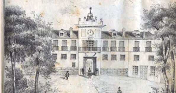
Escuela Nacional de Veterinaria de Madrid. De: Loubet, J. Colección de herraduras ó demostración del arte de herrar para corregir las enfermedades y defectos del casco. Madrid, 1843.