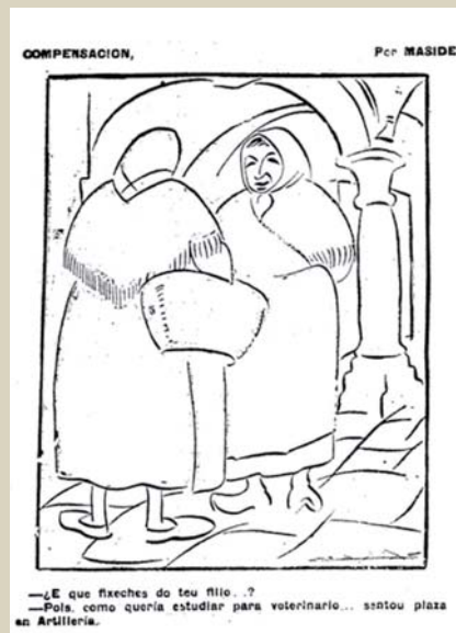
Viñeta de Maside publicada en El Pueblo Gallego el 13 de mayo de 1925.

Rechaza el argumento del número de alumnos como motivo para la supresión