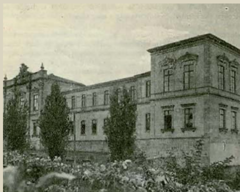
Vista general de la Escuela de Veterinaria de Santiago en el Pazo del Hórreo (1915) 1

Dentro del conjunto de estos grupos, los que más presión ejercieron para el restablecimiento de la Escuela fueron los agrupados alrededor del Galeguismo . Para estos, el mundo agrario cobra una especial importan-