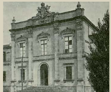
Fachada de la Escuela de Veterinaria de Santiago (1915).