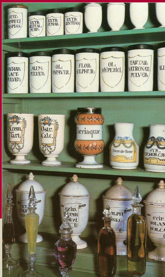
Botes y albarelos para guardar medicamentos, año 1800.