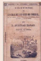
La cría de las aves de corral