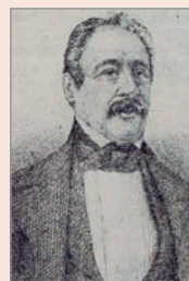
Nicolás Casas de Mendoza

Su obra fundamental fue el Tratado de la cría de las aves de corral, de las abejas, gusanos de seda, cochinilla, grana, quermos y de los peces , (1844) que completaría años más tarde, con Manual de la cría lucrativa de las gallinas y demás aves de corral (1872), verdadero compendio de ciencia avícola.