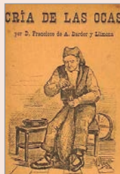
Cría de las ocas