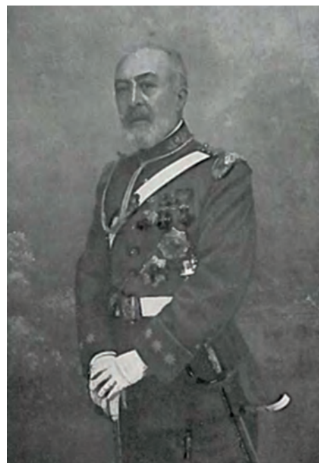
Figura 1. El Coronel A. Casares Gil en uniforme de gala.

así lo hace con varios. Sin embargo en el caso de D. Antonio es más enfático se refiere a: «Entre las diversas obras maestras de nuestro gran briólogo don Antonio Casares Gil» (3) .