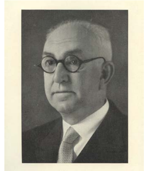
Don Cesáreo Sanz Egaña.

Poco antes del golpe de estado del 18 de julio de 1936 fue nombrado embajador de España en México y ya no volvería a pisar suelo español. Fue presidente del Consejo de Ministros de la República española en el exilio, de enero de 1951 a abril