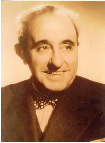
Don Félix Gordón Ordás