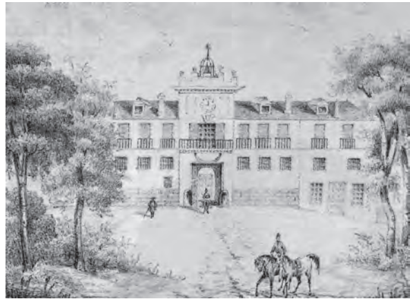
Primera escuela de 1793, situada en Recoletos, solar que actualmente ocupa la Biblioteca Nacional.

De esta presentación dió amplia referencia la prensa de la comarca, incluyendo una fotografía del busto de Malats. Posteriormente, al realizarse un amplio reportaje sobre científicos e investigadores históricos de la comarca de Osona, incluían a Segimon Malats, con su fotografía. 7