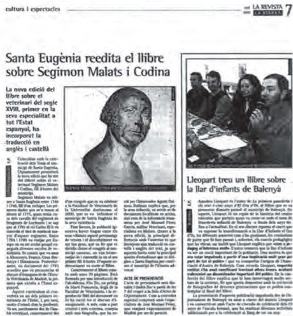
Reflejo en la prensa local del homenaje a Segismundo Malats en su localidad natal.

del discurs amb qué Segimon Malats inaugurará la Real Escuela de Veterinaria de Madrid (Any 1973).