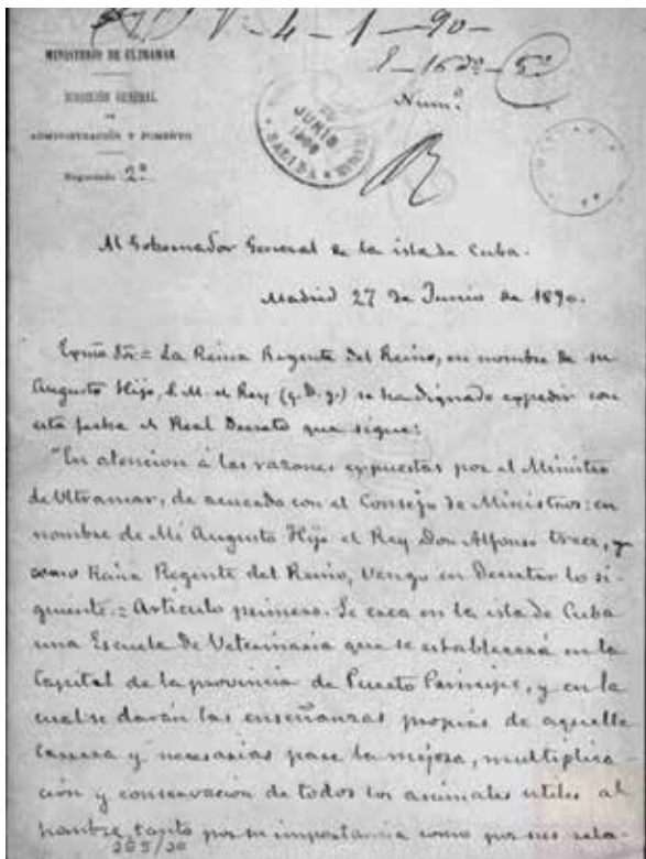
Establecimiento de la Escuela de Veterinaria de Cuba (1890) 17