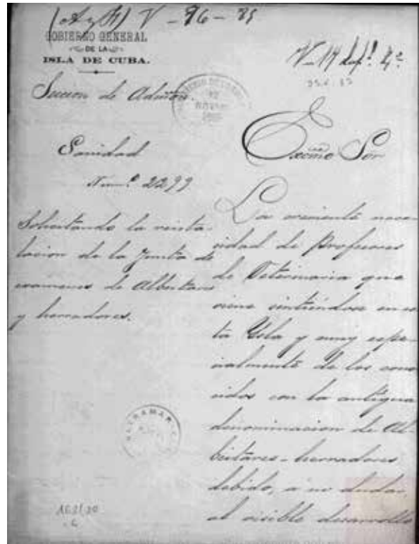
Solicitud de instalación de la Junta de exámenes de Albéitares y herradores en Cuba (1885) 18