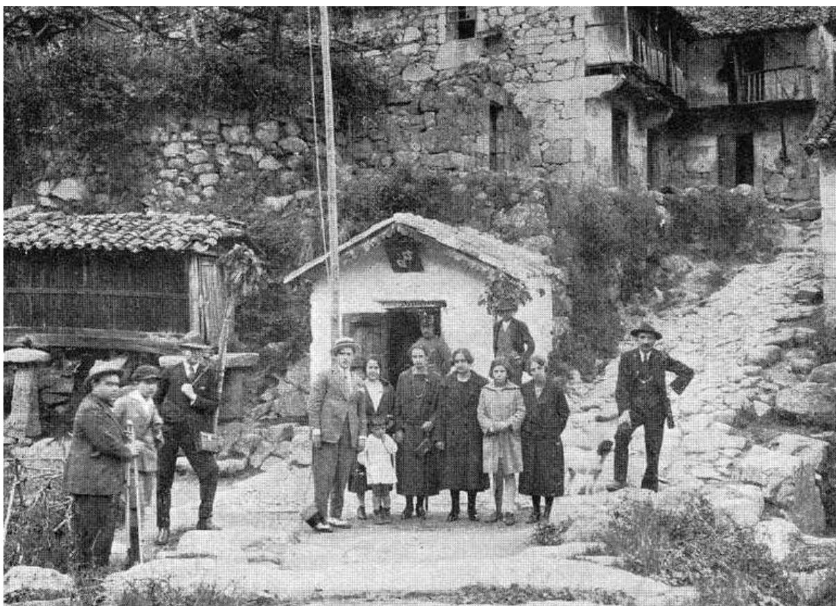
Puesto de los carabineros españoles y entrada a España por Ponte Barxas en 1924 20 .