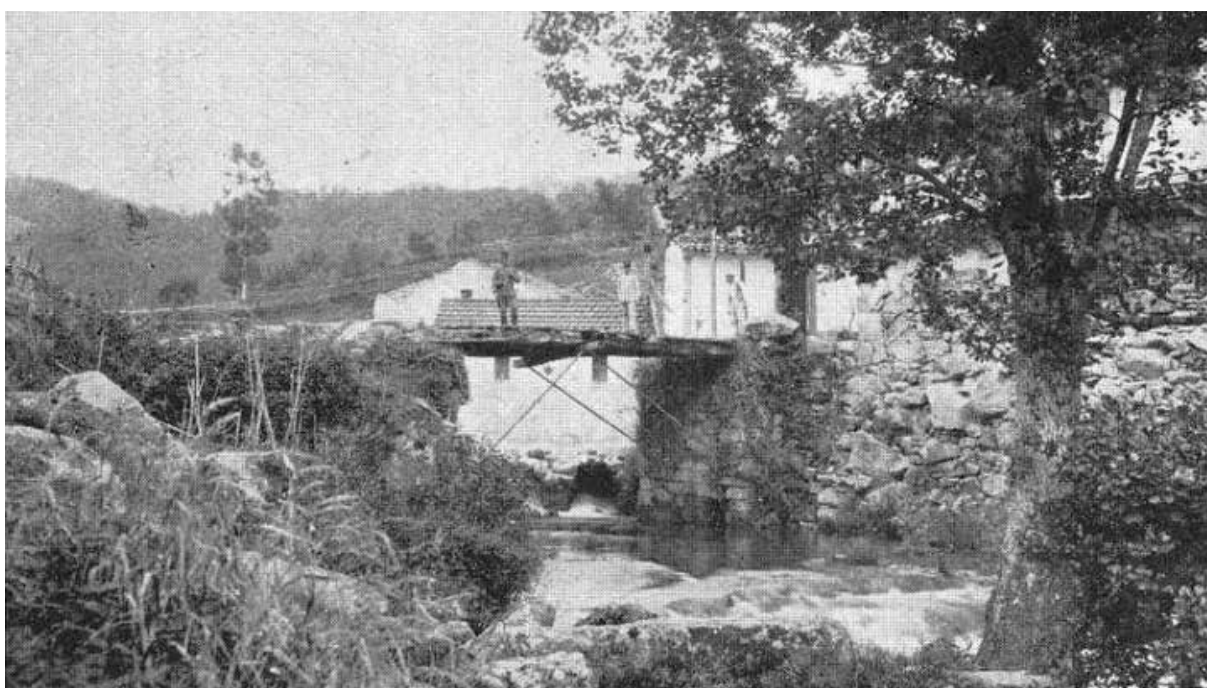
El puente internacional de Ponte Barxas fotografiado desde la orilla española en 1924 21