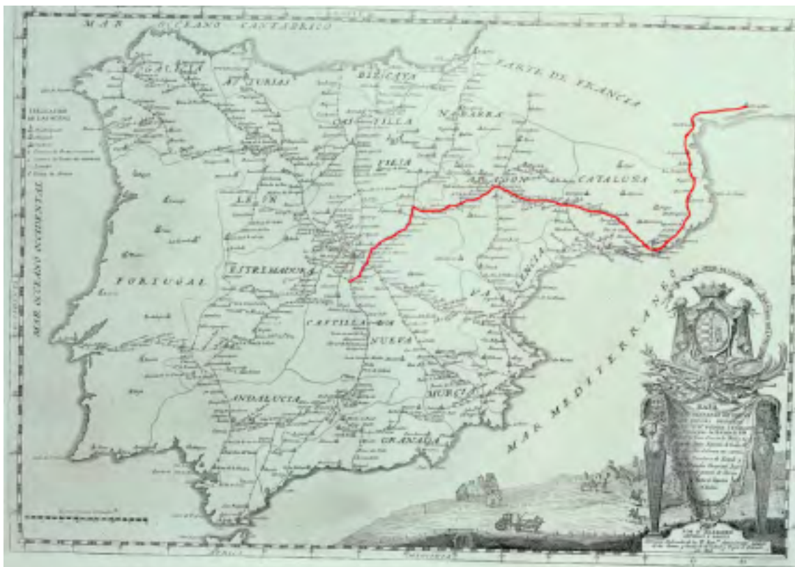
Mapa 3. Ruta seguida en España. Fuente: Elaboración propia sobre el Mapa de las carreteras y postas de España de Pedro Espinall y García. 1804.

En escrito fechado al día siguiente se amplía la información sobre la llegada de las yeguas y en particular se informa del estado de los animales en los siguientes términos “llegaron ayer las yeguas del Rey en el numero que expresa la noticia inserta, muy bien cuidadas y en muy buen estado, que es fortuna que en tan dilatada marcha por tierra, y que por que necesitan descanso las madres y los potros, pues son alajas que merecen conservarlas, y yo confieso que en su especie, no las he visto tan buenas, por su tamaño y hermosura”. En el mismo escrito aparece una nota adicional de mano distinta, posiblemente de letra y puño del Marques de la Mina, Capitán General de Cataluña desde 1649, quien plantea la necesidad de descanso para las yeguas y especialmente para los potros cuando dice “Excmo. Sr. Tengo presente la causa de que no se estuviesen aquí los cauallos pero en las yeguas me parece distinto el caso porque si los potros no se esfuerzan con según descanso se aventuran en el camino que les falta; el cochero que las a conducido merece premio porque vienen en bello estado”.