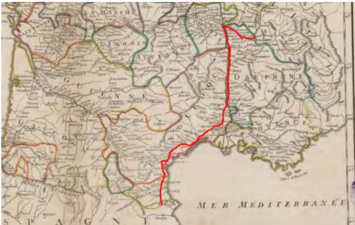
Mapa 2. Ruta seguida a través de Francia. Fuente: Elaboración propia sobre un mapa de Robert et Robert de Vagoudy, 1757, Atlas Universel, mapa 24.