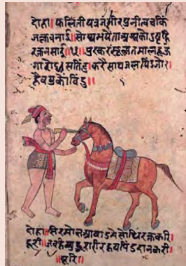
British Library. London. Ms. Hindi 12, S, Manuscrito indio del siglo XVIII. Se observa la administración oftálmica de material terapéutico mediante cánula.

cobre], 1 óbolo; de mirra, 2; de azafrán, una dracma; de tuétano de oveja como se ha escrito antes, una estatera. Estas cosas se trituran juntamente y tras añadir miel ática, úsala y unta la cicatriz. Y el tuétano la hará desaparecer poco a poco.