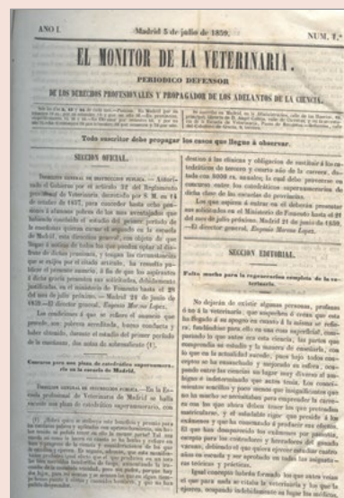
Figura 1.- Primer número publicado de El Monitor de la Veterinaria .

En el primer artículo de ese último número, que Casas titula “Despedida”, expone brevemente su deseo cuando indica: “En una palabra, hacia falta entre los veterinarios españoles un periódico dedicado pura y exclusivamente á la ciencia, que nunca diera cabida á personalidades de ningun género porque perjudican bajo todos conceptos y porque se conocen otros terrenos donde ventilarlas”. 2 Estas palabras ponen de manifiesto las tradicionales polémicas mantenidas con otras revistas profesionales, nacidas ya en la década de los años 50 del siglo XIX, como El Eco de la Veterinaria , fundada por antiguos alumnos de