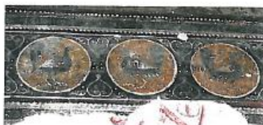
Fresco del siglo XII (San Juan de la Peña, Huesca).

aves. Además de los griegos y romanos, previamente también los fenicios habían contribuido de forma importante a la difusión de las gallinas domésticas en Europa. El paso de las gallinas al continente americano sería obra de los colonizadores españoles a partir de finales del siglo XV.