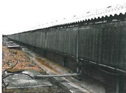
El enorme desarrollo de la avicultura industrial ha posibilitado el acceso, a una gran mayoría de la población, a los productos avícolas (nave de ambiente controlado).

aves. Además de los griegos y romanos, previamente también los fenicios habían contribuido de forma importante a la difusión de las gallinas domésticas en Europa. El paso de las gallinas al continente americano sería obra de los colonizadores españoles a partir de finales del siglo XV.