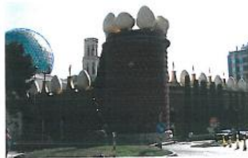
Museo Dalí con el "huevo como obsesión" (Figueras, Girona).